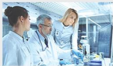
Sciences biologiques et la santé