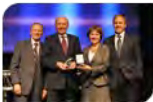
Prix Carrière institutionnelle