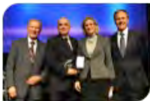
Prix Carrière industrielle

Quatre Prix d'Excellence ont été décernés en 2008 à des personnalités qui ont contribué de façon exceptionnelle à l'essor de la recherche et du développement technologique du Québec.