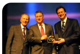
Prix Coup de cœur du Jury