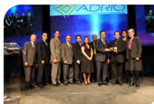
Prix Innovation | Produit