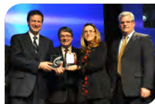
Prix Innovation | Verte

Odotech et l'École Polytechnique de Montréal