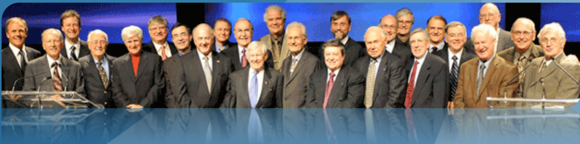
Les « bâtisseurs » de l'écosystème d'innovation au Gala ADRIQ 2008

Voilà des réalisations dont il convient de se réjouir et qui méritent d'être célébrées !