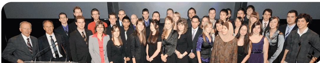
La « Relève » au Gala ADRIQ 2008

RCMM, Septembre éditeur, Action TI et de nombreux partenaires de diffusion