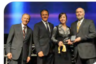
Prix Jeune Innovateur