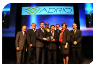
Prix PME innovante

Six Prix INNOVATION ont été attribués en 2008 à des entreprises qui se sont démarquées par leur créativité, l'excellence de leurs réalisations et leur succès obtenu auprès de leurs marchés.