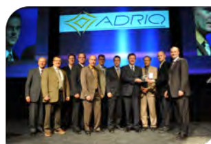
Prix Innovation | Procédé